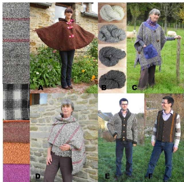
Fig. 3 : Une sélection des produits fabriqués par les Toisons Bretonnes. A gauche , les détails de quelques tissus tissés avec de la laine de couleur origine ou avec un mélange de laine teinte et non-teinte. A : Cape, tissu tissé avec un mélange de laine teinte et non-teinte. B ; laine non-teinte, gamme Origine. C . Ruana, tissu tissé avec de la laine bi-couleur noire et blanche. D Châle. E , veste tricoté avec de la laine non-teinte. F gilets en tissu tissé avec de la laine gris foncé, gamme Origine, le motif de décoration est en laine teinte. Photos : Les Toisons Bretonnes (St Senoux, Fr.)

En plus de la commercialisation de la laine nous sommes aussi des tisserands. Sur nos métiers à tisser manuels nous fabriquons des tissus en laine qui sont utilisés pour faire un certain nombre de vêtements. Lorsque cela est nécessaire nous travaillons avec une styliste locale. Les tricotés sont fabriqués pour nous par les auto-entrepreneurs locaux. En raison des caractéristiques de la laine les vêtements sont faits pour mettre par dessus d'autres : ponchos, capes, pulls, gilets, cardigans ou châles (Fig. 3). En addition, pour promouvoir cette laine, et la laine comme une fibre textile en générale, nous participons à des expositions et fêtes/foires avec les ateliers pratiques de filage et tissage pour les enfants et les adultes et des posters d'informations sur la laine.