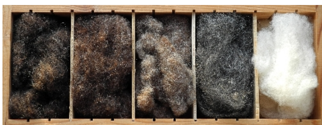
Fig. 2 : Échantillons de laine de Landes de Bretagne montrant la gamme de couleurs. La couche interne de la laine chez les adultes et la laine des agneaux peuvent être bien plus foncées.

Le transformation de la laine utilise le circuit original, lavage à Laurent Laine (Saugues) et filage à la filature Terrade (Felletin). Une partie de la laine blanche est teinte chez Terrade avec les couleurs choisies par nous et conformes aux normes Oekotex 100. Une autre partie est teinte avec les produits naturels par nous ou par "Couleurs Sauvages" (56 Peillac). La laine filée est commercialisée en trois gammes :